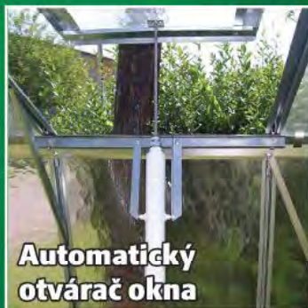
Automatický otvárač okna